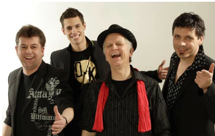
Es wird pfälzisch gerockt mit den „Pälzer Helde“.

Mit einem Ausschnitt aus „A Chorus Line“ begeistert der Tanzsportclub Royal Rülzheim e. V. die Zuschauer. Der Verein ist nicht nur auf sportlicher Ebene erfolgreich, sondern auch ehrenamtlich engagiert. Von allen Mitgliedern sind etwa 250 in zwölf Gruppierungen mit ehrenamtlich tätigen Trainern und Trainerinnen tänzerisch aktiv. In pfälzischer Mundart präsentieren sich die „Pälzer Helde“ den Messebesuchern. Die mit dem „Südpfälzer Musikerpreis“ ausgezeichnete Band um den rockenden Rechtsanwalt setzt auf klare und eingängige Rhythmen, kombiniert mit pfiffigen Texten.